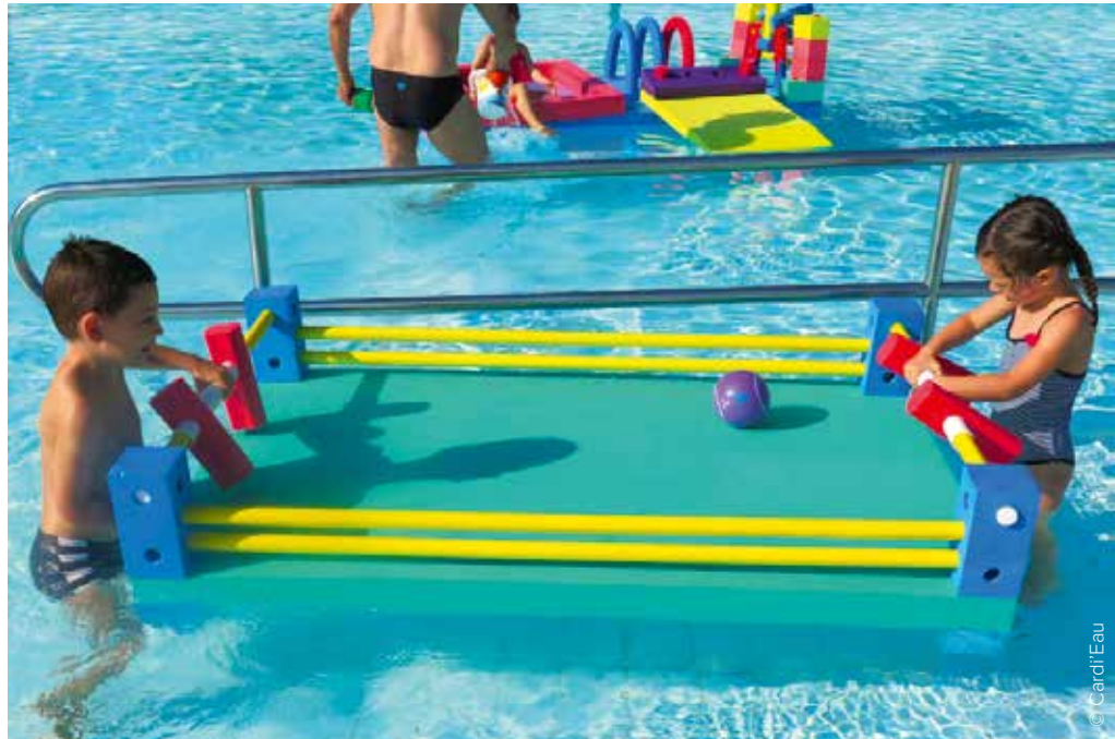
La Aqua Baby Foot de Cardi'Eau peut être installé dans une pataugeoire afin de divertir les enfants tout en développant leur motricité et les encourager à effectuer leurs premières immersions. Les différentes parties s'emboîtent facilement.

De manière générale, les sociétés doivent prendre en compte plusieurs contraintes lorsqu'elles commercialisent ce type de