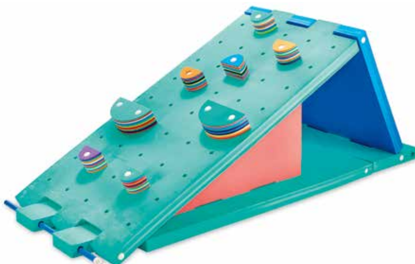
Le mur d'escalade flottant d'Abysses Sport est spécialement pensé pour les parcours pédagogiques en piscine : cette structure s'assemble facilement et rapidement aux tapis et autres structures de la gamme Ludi'O. Elle se range grâce à la découpe dans les tapis qui permet de les plier entre eux.

Dans tous les cas, il est essentiel que le nombre de matériel s'adapte à la taille du bassin accueillant les activités d'apprentissage et à l'espace de stockage de l'établissement.