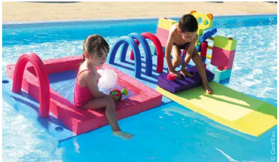
Plusieurs caractéristiques sont à prendre en compte lors du choix de matériels pédagogiques : la mise en place de plusieurs situations, le temps de pratique, la durée d'installation ou encore le rapport qualité/prix.

Les radeaux sont également largement proposés par La Maison de la Piscine. Par exemple, le Rad'eau d'angle pour orienter les parcours pédagogiques dans de multiples directions. Il permet de mettre en place différentes zones en le reliant à trois radeaux, ou un long parcours dans une zone restreinte en faisant des déviations de 45° ou 90°. L'entreprise commercialise également le Rad'eau à obstacles (dimensions : 200 x 100 x 60 cm) ou le Rad'eau bulles (dimensions : 200 x 100 x